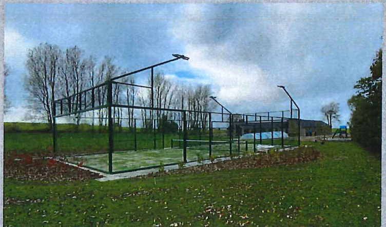
Privat opførsel af 1 udendørs panoramabane på Fyn oktober 2020