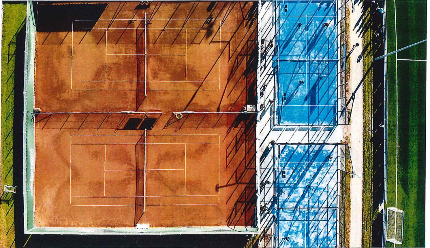
Ullerslev tennisklub opfører 2 udendørs padelbaner Pro One november 2020