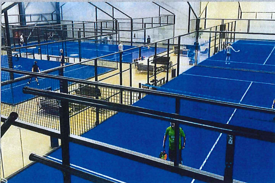
4 indendørs panoramabaner opført i My Padel Club i Slagelse juni 2019